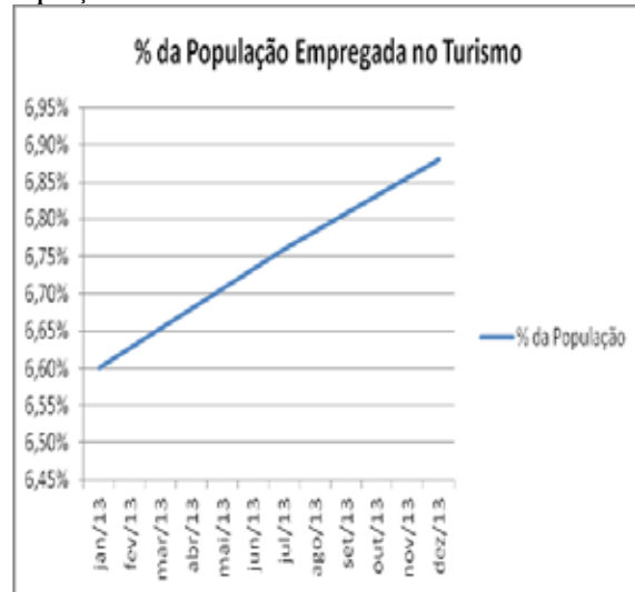
População empregada no Turismo - 2013

Importante a percepção de que os números estão crescendo. Durante o ano de 2013, houve um incremento acumulado de 3,51% no número de empregos vinculados ao setor de turismo.