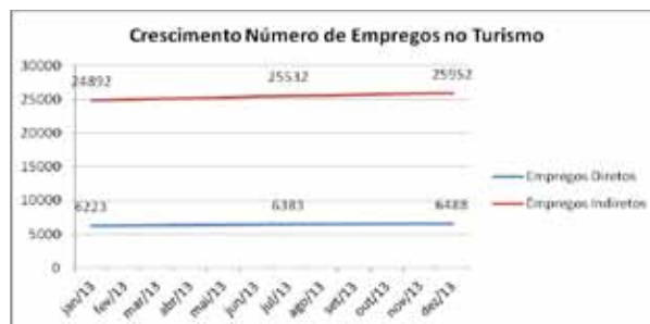
Crescimento do Número de Empregos no Turismo - 2013

Importante a percepção de que os números estão crescendo. Durante o ano de 2013, houve um incremento acumulado de 3,51% no número de empregos vinculados ao setor de turismo.