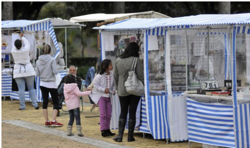
Imagem da Barraca para Referência de cores

A Unidade de Gestão de Agronegócio, Abastecimento e Turismo não indica e nem negocia com fabricantes de barracas.