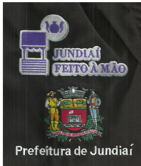
Modelo de Avental e Bordado com Logo do Programa Jundiaí Feito à Mão e Brasão da Prefeitura de Jundiaí